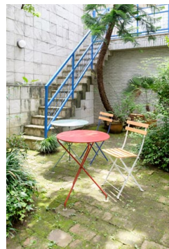
ガーデンテーブル 赤・グリーン各1台、 チェア4脚