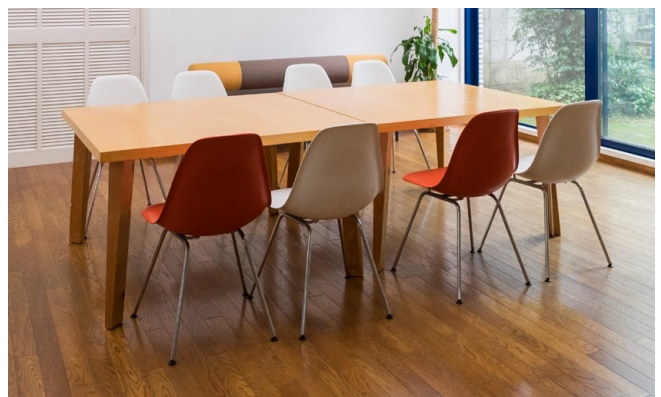
白イス6脚/赤イス2脚/ソファ1脚 (W180×L64cm)